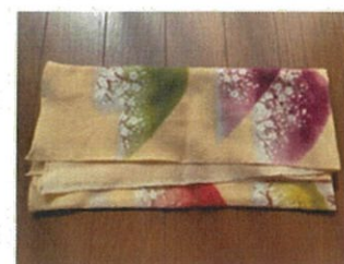
風呂敷 (大判のもの)