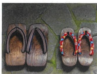
下駄(草履) (なければサンダル) ※足袋は不要です