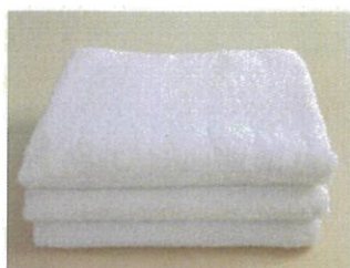
薄手フェイスタオル (温泉タオル) 男性 2枚・女性 3枚