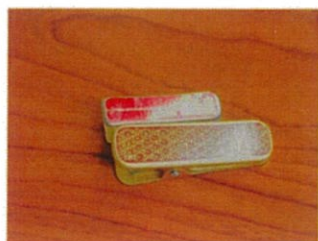
着付けクリップ 2個