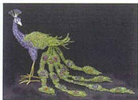
クジャクのビーズアート

日本人アーティストユニット、ZUVALANGA(ズワランガ)による世界を、ご体感ください。