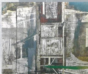
「wall-構成と蓄積-」 (第9回日展 特選)

日時 6月29日(日) 14時~ 会場 当館ロビーギャラリー 入館料のみでご参加いただけます。