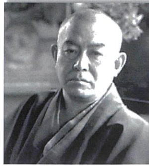
写真左上：路地と中門 上中：庭から母屋を望む 右上：書斎 左下：玄関 右下：谷崎潤一郎