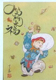
阿藤 無華氏 作

優しく穏やかな仏さまの表情は、見る人の気持ちまでも安らかにさせてくれます。技と心を磨いて仕上げた作品の数々をご覧ください。講師は仏画師範の阿藤無華氏。