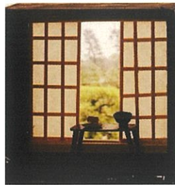
13 日体験見本 部屋のサイズ1辺7cm