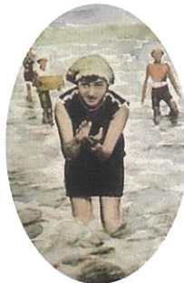
14 日体験見本 「せい子」A4サイズ