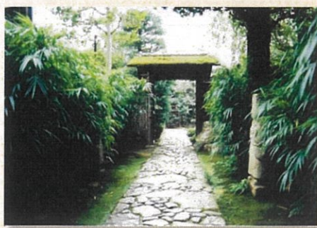
写真左上：玄関 右上：書斎 左下：庭から母屋を望む 右下：路地と中門