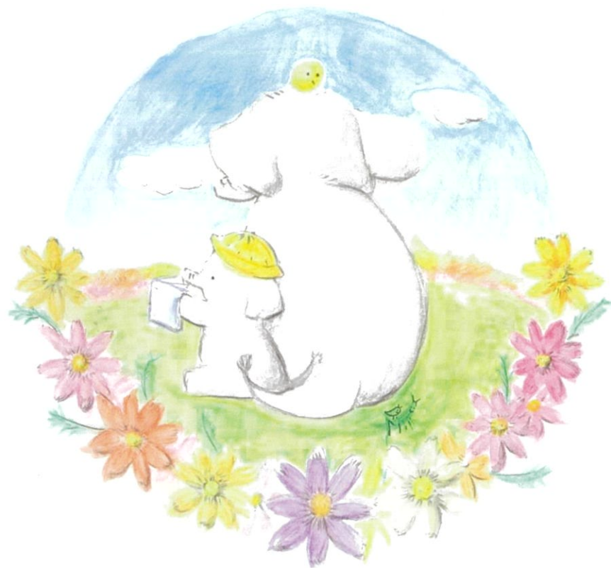
イメージキャラクター 楽しく読むゾウ