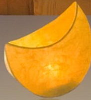
体験講座作品見本「月あかり」

イベント参加者の個人情報は、個人情報保護法及び当館を運営する小学館集英社プロダクション共同の個人情報取り扱い方針に基づき厳重に管理し、適正に取り扱います。