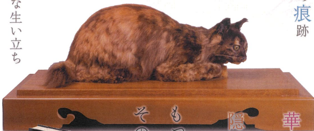
谷崎の愛猫「ベル」の剥製