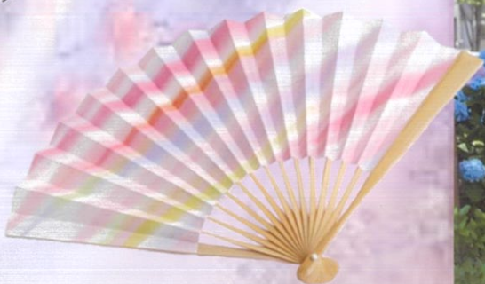
扇子『恋する夕焼け』

イベント参加者の個人情報は、個人情報保護法及び当館を運営する小学館集英社プロダクション共同体の個人情報取り扱い方針に基づき厳重に管理し、適正に取り扱います。