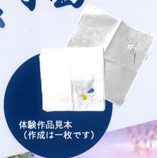
体験作品見本 (作成は一枚です)