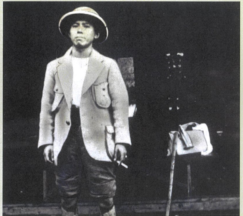
1923(大正12)年9月 関東大震災を逃れて芦屋にたどりついた谷崎