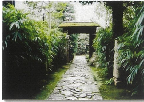
写真左上：潺湲亭玄関 右上：潺湲亭書斎 左下：庭から母屋を望む 右下：潺湲亭路地と中門