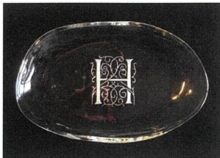
「イニシャルプレート」15×9×1.5センチ

ヨーロッパのガラス工芸。ダイヤモンドの粒子を用いた針で、ガラスの表面に線刻や点描をほどこし、繊細に絵柄を彫り上げます。