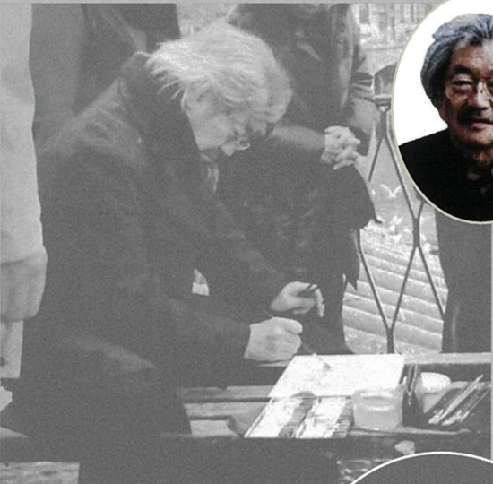
冬のプラハにてカレル橋を描く