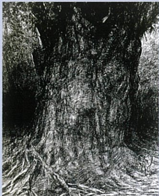
「生きる」 屋久島縄文杉