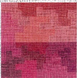
「タンツアードのない世界」