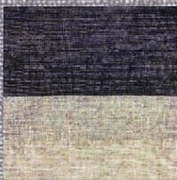
「タンツアードのある世界」

布のように見えますが油絵です。木製キャンバスに描いています。描くというよりは線を置いていき、固まったらまたその上に線を重ねていくことで立体感が生まれ、角度を変えて見ることで表情が変わります。抽象画ですがそういう絵の表情を楽しんでいただければ幸いです。