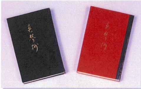
職人が手仕事で仕上げた漆塗り装丁の「春琴抄」初版本

「初版本」—その言葉の響きには、独特の緊張感がある。それは、数多くの名作たちにとっての、一度きりの「デビュー」なのだ。装丁にこだわった谷崎の場合、自作の晴れ舞台への思い入れはとりわけて強く、念入りなドレスアップとメイクアップが施されている。展示では、そんな谷崎作品初版本の数々を、「売り買いされる商品」としての書籍という視点をもからめながら紹介する。