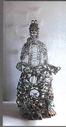
MIROKU 素材：チラシ、DM、木、紙菅