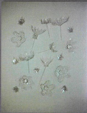
花 素材：ペットボトル