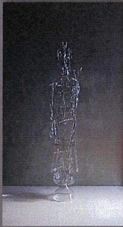
観音 素材：ペットボトル