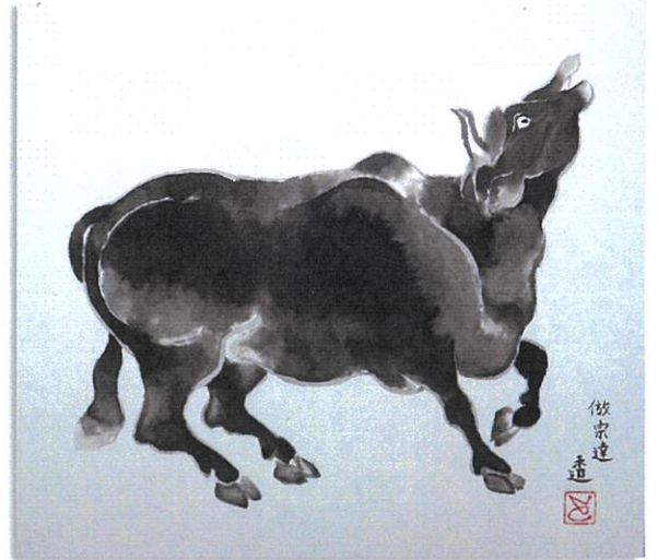
「倅 俵屋宗達 牛図」長谷川透画